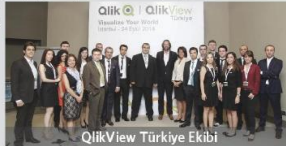
QlikView Türkiye Ekibi

www.qlikview.com.tr Tel: (0212) 213 15 00